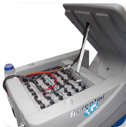
batterie al gel o acido con grande autonomia Lead acid or gel batteries with great autonomy