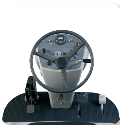
comandi semplici e intuitivi simple and intuitive controls